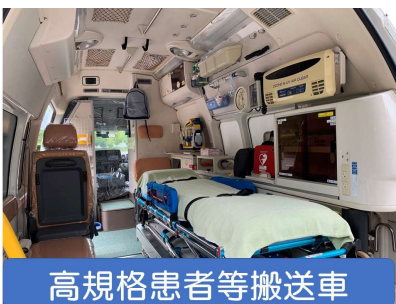
高規格患者等搬送車