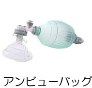
アンビューバッグ